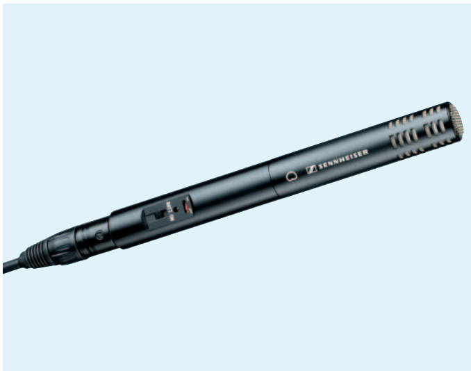
Der abgebildete Speiseadapter K6 gehört nicht zum Lieferumfang.

Das ME 64 ist ein Mikrofonmodul, das zu den Speiseadaptern K6 und K6P paßt. Es eignet sich für den Einsatz bei Reportagen, Interviews, Nachvertonungen und Beschallungsanlagen. Oberfläche: mattschwarz eloxiert, kratzfest.