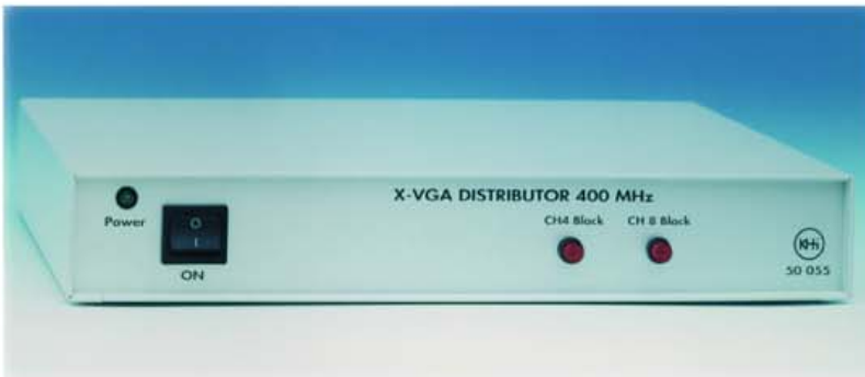
SL - HOUSING